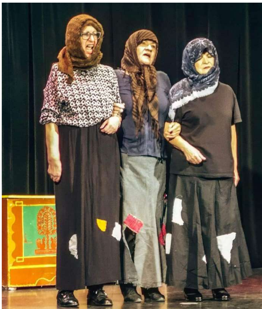
Zdjęcie ze spektaklu „Uciechy staropolskie” wg scenariusza Kazimierza Dejmka

Kochać i wierzyć, to zbrodnią kobiety. A jej zalety zdeptano, niestety! Bóg tylko jeden sąd kiedyś umieści Od niemowlęctwa do łoża boleści.