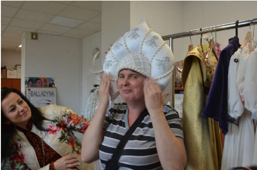
Uczestniczki spaceru sensorycznego dla g/Głuchych w pracowni krawieckiej